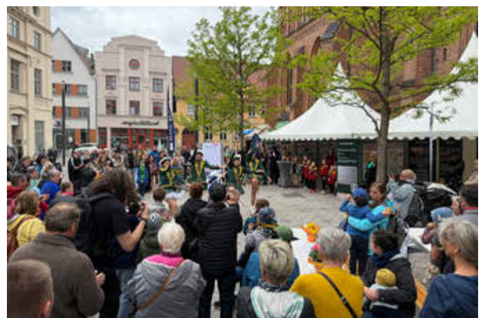
Foto: Tag der Städtebauförderung im Jahr 2025

Mit dem Tag der Städtebauförderung macht die Barlachstadt Güstrow sichtbar, wie sich der Markt als Herz der Stadt verändert hat und wie er nun wieder zu einem Ort wird, an dem Menschen zusammenkommen.