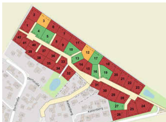
Karte Suckower Tannen

Die Baugrundstücke im Baugebiet „Suckower Tannen“ befinden sich im Bereich der rechtskräftigen Bebauungspläne Nr. 6a und 6b. Der Festpreis beträgt 100,00 €/m 2 . Eine Vergabe zum Festpreis von 95,00 €/m 2 kann an Familien mit einem Kind unter 14 Jahren erfolgen. Für jedes weitere Kind unter 14 Jahren reduziert sich dieser Festpreis um jeweils 5,00 €/m 2 . Voraussetzung dafür ist, dass die berücksichtigten Kinder ihren Wohnsitz auf dem zu erwerbenden Grundstück nehmen werden. Der Erwerb wird an eine Bauverpflichtung innerhalb von 5 Jahren geknüpft. Es ergeht zusätzlich der Hinweis, dass nach Auskunft des Landesamtes das Grundstück voraussichtlich noch auf einer kampfmittelbelasteten Fläche liegt, die vor einer möglichen Bebauung eine bauherrenseitige Beräumung erfordert.